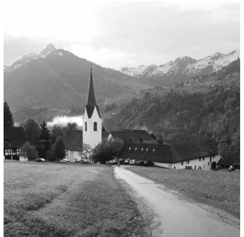
Die Propstei St. Gerold hat sich International einen Namen geschaffen als Ort der spirituellen Entwicklung. Seit 1996 unterstützt die Energie des Umfeldes den Prozess der persönlichen Visionsfindung. In der Nähe von Feldkirch im Grossen Walsertal wird die Basis für eine erfolgreiche Zukunft gelegt.

Werden diese Zeichen nicht erkannt und ignoriert, reagiert der Körper mit Krankheiten, die den Menschen zur Umkehr zwingen. Dann wird auf einer