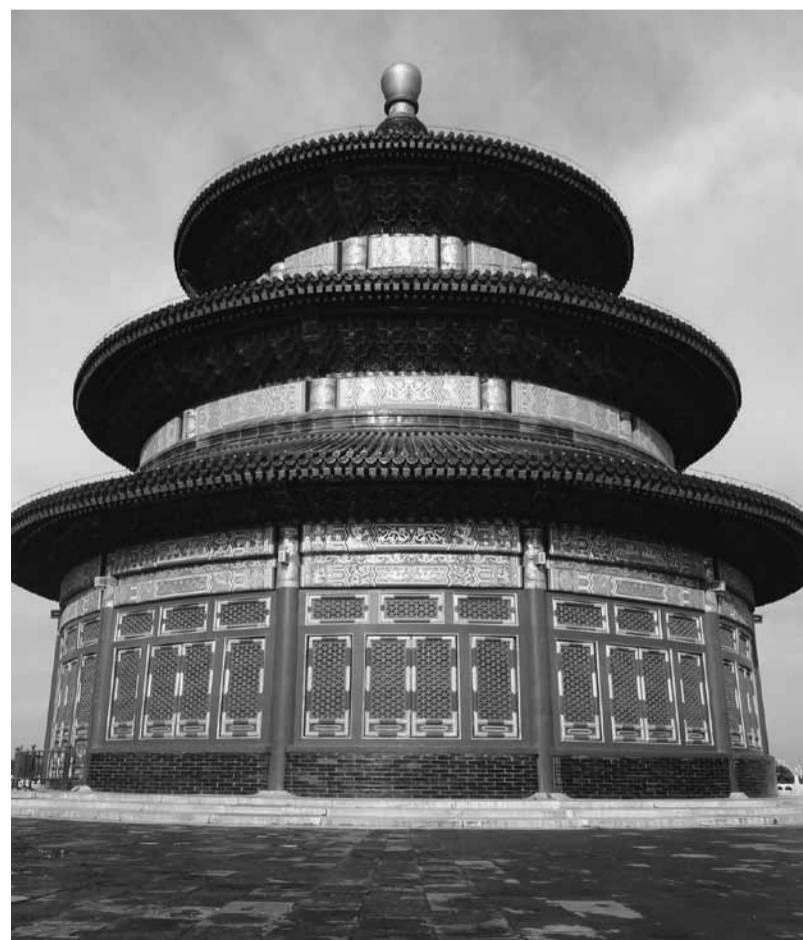
Die Gelehrten Chinas haben in ihrer langen Geschichte ein Weltbild geschaffen, das nach wie vor seine Gültigkeit hat. Eindrückliche Zeugen davon sind noch immer sichtbar. Hier der Himmelstempel, der ein überdimensionaler Lo Pan, das Messinstrument der Feng Shui Experten, in 3D darstellt.

Wir alle kennen die Probleme, mit denen sich das chinesische Volk auseinander setzen muss. Wie sieht es heute aus, nachdem die grosse Öffnung vollzogen ist? Nutzen die Chinesen ihr altes Wissen noch oder ist es im Sog des wirtschaftlichen Aufstiegs unter gegangen?