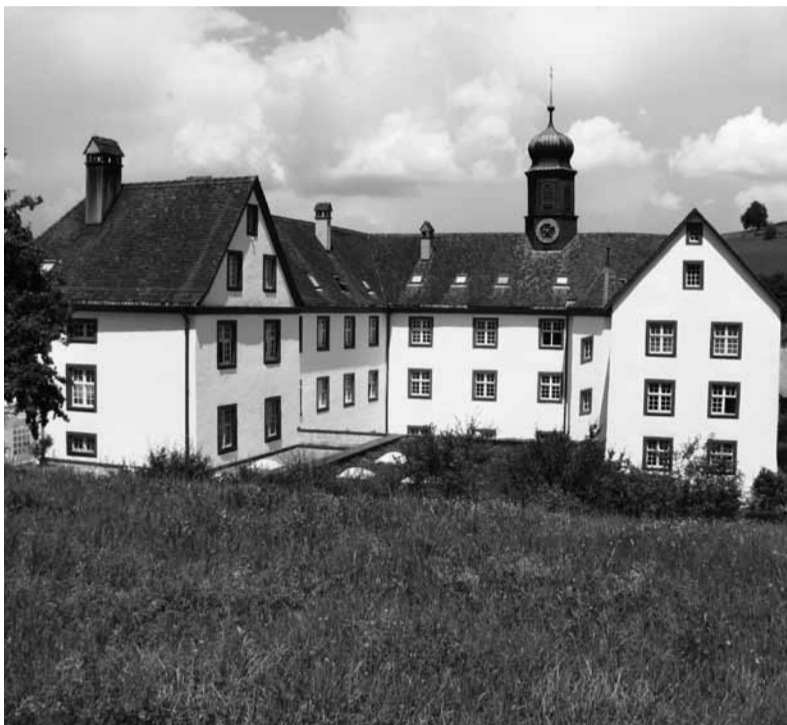
Die Umgebung unterstützt den Spass am Lernen. Die Propstei Wislikofen bietet das perfekte Umfeld, um Theorie und Praxis zu verbinden. Die Umgebung lädt dazu ein, das Gelernte als eigene Erfahrung zu speichern. Das ist die Basis des Super-Learning-Konzepts, mit der die Feng Shui Schule Schweiz ausbildet. Dadurch verringert sich der zeitliche Aufwand und der Spassfaktor nimmt zu.

Feng Shui bringt klare Wettbewerbsvorteile, durch zusätzliche Fähigkeiten in allen Branchen und nicht nur in den dafür naheliegenden Baubranchen. Im Grunde ist es der perfekte Persönlichkeits-Entwicklungs-Prozess. Das geht oft vergessen, da dies kaum mehr so gelehrt wird. Sogar in China, wo man denken könnte, die sollten es noch wissen. An den Info-Abenden, erhalten Sie einen Einblick in die Vielfalt dieser spannenden Ausbildung. ♥